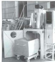
Der Zentrifugal-Separator trägt bis zu 50 kg stichfesten Lackschlamm pro Stunde aus.

Als einer der führenden Hersteller von hochwertigen Automobil-Komponenten und Bediensystemen für die Consumergeräte-Industrie betreibt Reum GmbH in den Werken Calw und Hardheim fünf automatische Nasslackieranlagen mit insgesamt zehn Lackierkabinen zum Beschichten von Kunststoffteilen. Verarbeitet werden Lösemittel- und Wasserlacke. Als Lackschlamm-Austragsgeräte setzte das Unter-